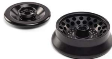
FA361.5 アルミニウムロータ

最大回転数：15,000 rpm 最大遠心力：20,627 xg 24本×1.5 / 2.0 mL