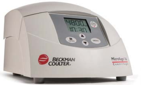
Microfuge 16 (空冷モデル)