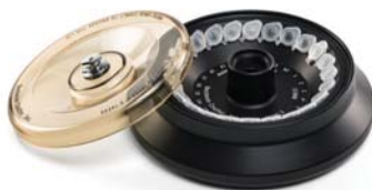
FA241.5 アルミニウムロータ BIOC

最大回転数：15,000 rpm 最大遠心力：16,602 xg 4セット×PCR 8連チューブ (32本 x 200 μL)