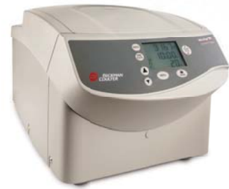
Microfuge 20R (冷却モデル)