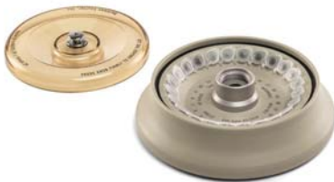
FA241.5P プラスチックロータ (標準付属)