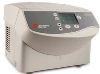
Microfuge 20 (非冷却モデル)