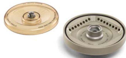
FA4X8.2P プラスチックロータ BIOC

最大回転数：15,000 rpm 最大遠心力：20,627 xg 24本×1.5 / 2.0 mL